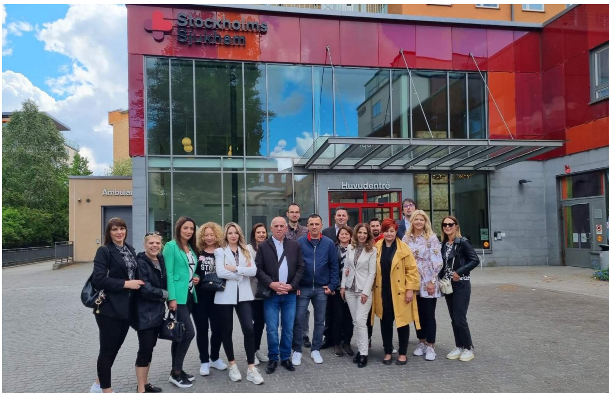
Slika 1 Projektni timovi na studijskom putovanju u Švedskoj

ustanova Dom zdravlja Zenica (JUDZZ) i Javna zdravstvena ustanova Dom zdravlja Podgorica (JZUDZP). Sve četiri institucije imaju bogato iskustvo u pružanju usluga primarne zdravstvene zaštite. Uz navedeno DZLJ jedna je od rijetkih institucija u regiji koja posjeduje hospicij te bogato iskustvo u pružanju usluge palijativne skrbi. DZLJ i DZM koristili su znanje stečeno projektom Q-Access kako bi pomogli JZUDZP i JUDZZ u uspostavljanju usluge palijativne skrbi. Vodeći partner, DZM, koordinirao je implementacijom projekta no svi projektni partneri zajednički su radili na provedbi projektnih aktivnosti.