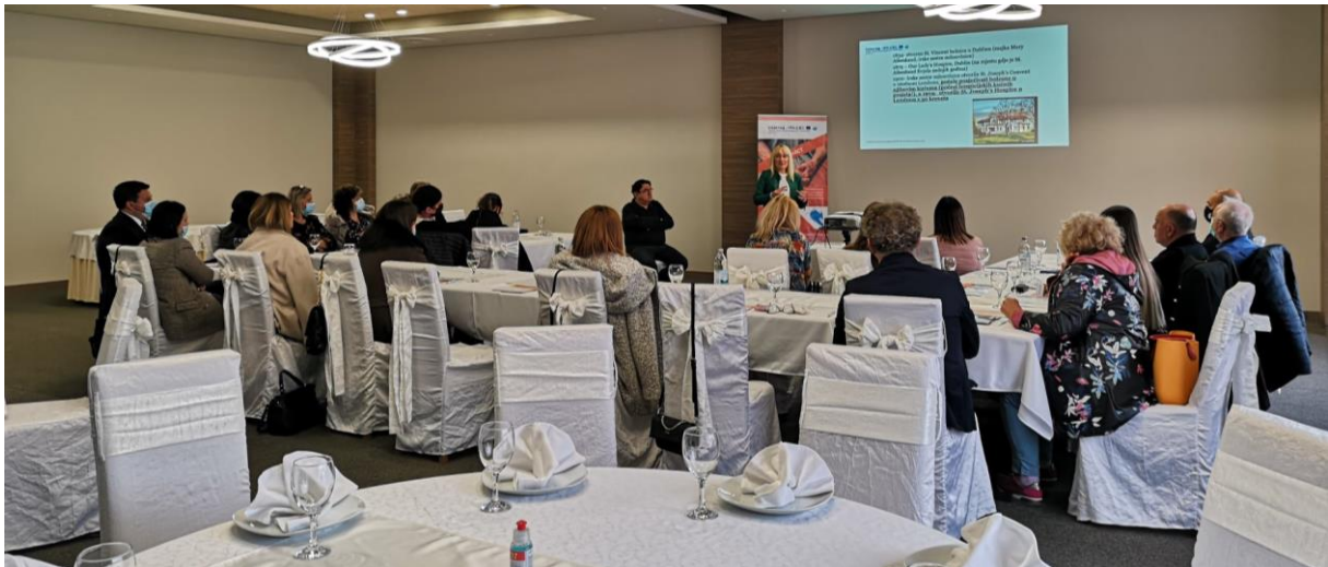
Slika 2 Edukativna radionica za zdravstvene djelatnike, Ljubuški

godina, koje ujedno čine glavne potencijalne korisnike usluga palijativne skrbi. Glavne ciljne skupine koje su imale koristi od projekta su pacijenti sa terminalnim bolestima, liječnici i medicinske sestre, socijalni radnici i članovi obitelji pacijenata.